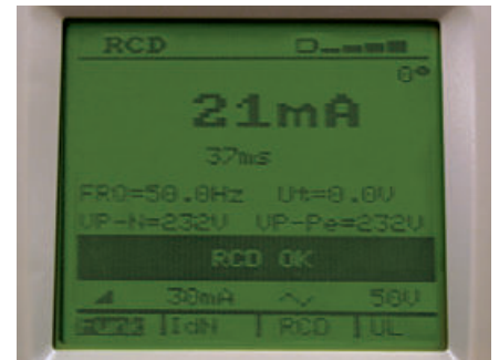
RCD Test mit ansteigendem Prüfstrom und Anzeige der Messergebnisse