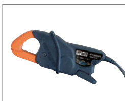
HT4005N Mini-Stromzange, 2 Messbereiche 5/100 A, ab 5 mA bis 100 A AC