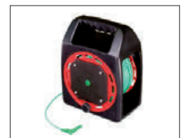
TL-50MKT Verlängerungsleitung 50 m, grün, auf praktischer Kabeltrommel