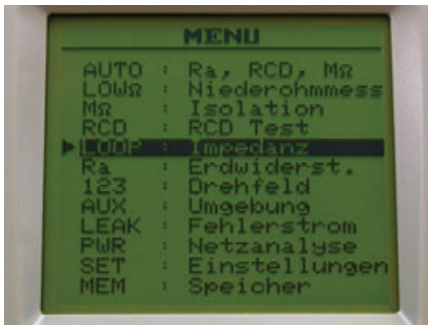
Einfache und übersichtliche Auswahl der Messfunktion