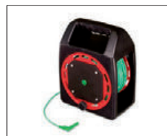
TL-30MKT Verlängerungsleitung 30 m, grün, auf praktischer Kabeltrommel