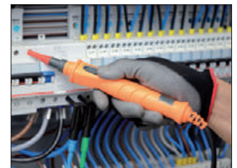
PR400 Externe Prüfspitze mit Start/Stop Taste