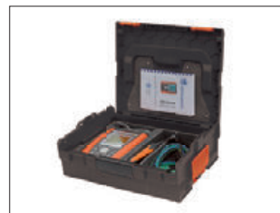
HT-Sortimo L-Boxx Verlickbar-Stapelbar-Kompatibel Ordnung wird tragbar, die L-BOXX von Sortimo passt überall.