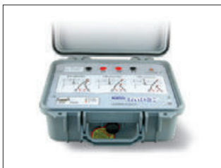
IMP57 Zubehör für Schleifenimpedanzmessung mit hoher Auflösung, max. 200 A Prüfstrom