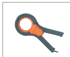
HT97U Zange bis 1000 AC 3 Messbereiche: 10/100/1000 A AC