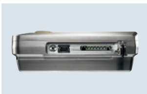
Seitlicher Anschluss von Mini-USB-Kabel und SD-Karte