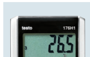
Großes und übersichtliches Display zur Messwertanzeige