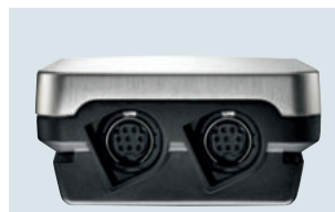
Fühleranschlüsse am unteren Gehäuseende für zwei Temperatur-/Feuchtefühler