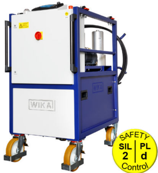
Gastrocknungsanlage, Typ GAD-2000